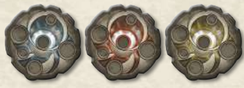
Жетоны ключей (нескованные)

Сложите все жетоны урона и янтаря, оглушения, силы, ярости и защиты в пределах досягаемости всех игроков — это общий запас.