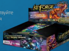
Дисплей «Массовая мутация»