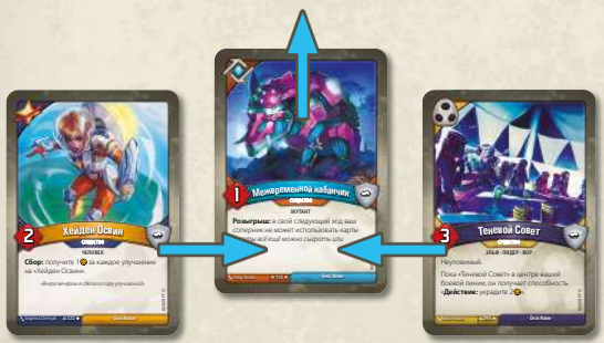
Существо из центра боевой линии покидает игру, и боевую линию смыкают

Когда существо покидает игру, сомкните боевую линию так, чтобы в ней не было пробелов.