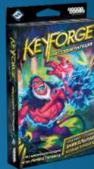
Уникальная колода «Массовая мутация»

Если вы готовы к соревновательной игре, участвуйте в турнирах и чемпионатах, которые проводятся при поддержке Fantasy Flight Games Organized Play. Ищите нас на сайте KeyForgeGame.com .