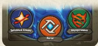
Три дома указаны на карте архонта

В каждой колоде KeyForge присутствуют 3 дома, чьи гербы изображены на карте архонта. На этом этапе активный игрок выбирает один из трёх домов, и этот дом становится активным до конца хода. Активный дом определяет, какие карты игрок может разыграть, сбросить с руки или использовать на этом ходу.