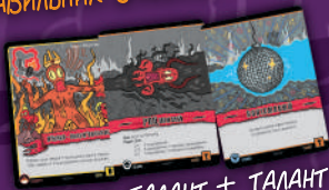
ВИТИК + ТАЛАНТ + ТАЛАНТ