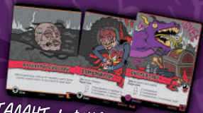
ТАЛАНТ + ФІНАЛОЧКА + ФІНАЛОЧКА

ЯКЩО ЯКИЙСЬ РОЗУМНИК ПІДГОТУЄ НЕПРАВИЛЬНЕ ЗАКЛЯТТЯ, ТО ПОВИНЕН ВИЛУЧИТИ З НЬОГО ЗАЙВІ КАРТИ ТАК, ЩОБ ЗАКЛЯТТЯ СТАЛО ПРАВИЛЬНИМ. ВИЛУЧЕНІ КАРТИ СЛІД КЛАСТИ У СКІД.