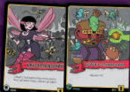
ВИТИК + ВИТИК