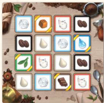
Поле інгредієнтів x 1