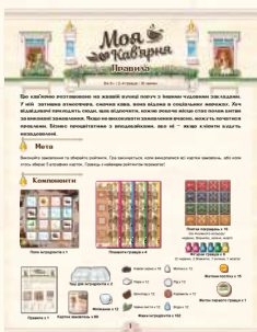
Правила x 1