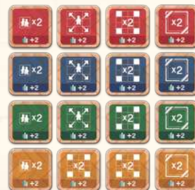
Плитки покращень x 16 (по 4 кожного кольору: червоні, блакитні, зелені, жовті)