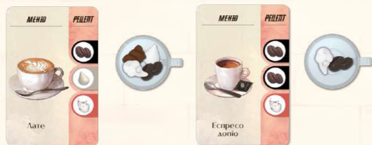
Приклад правильно виконаного замовлення