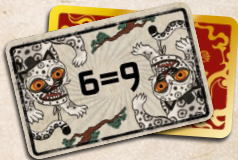
карти «ЩЕ ГОСТРИШЕ!»