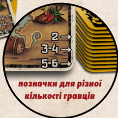
позначки для різної кількості гравців