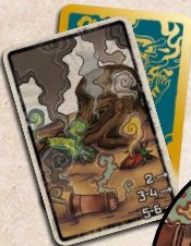
карта кінця гри