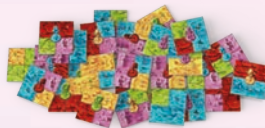
55 плиток Місцевості