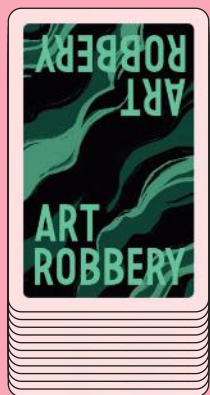
Колода запасу, долілиць