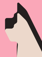
Фігурка сторожового пса

Довкола 3-го раунду точаться дискусії. У поточній версії 3-ге пограбування містить 2 фішки «наглядачки» та жодної фішки із цифрою 5. Спершу ми грали так, ця асиметрія додає грі шарму. Але схоже, що це — помилка видавця, і в цьому пограбуванні теж мала бути 1 «п'ятірка» і 1 «наглядачка». Нам подобаються обидва варіанти — тож рекомендуємо вам спробувати грати і з однією «наглядачкою», і з двома.