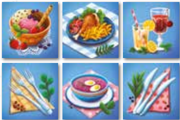
Початкове розташування жетонів гравця

Розділіть жетони на групи – окремо ножі , окремо виделки і т.д. Ретельно перемішайте кожен комплект та розкладіть зображенням чистого посуду горілиць. Кожен гравець отримує по одному жетону кожного типу та викладає перед собою, не дивлячись на малюнок на звороті та не показуючи його іншим гравцям. Розташування жетонів кожного разу повинне бути однаковим: десерт , друга страва , напої ; в другому рядку: виделки , суп , ножі .