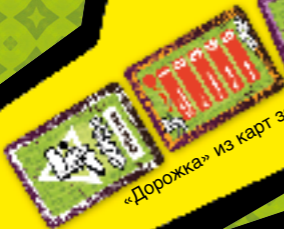
«Дорожка» из карт заданий