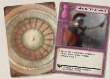
7 карт ролей