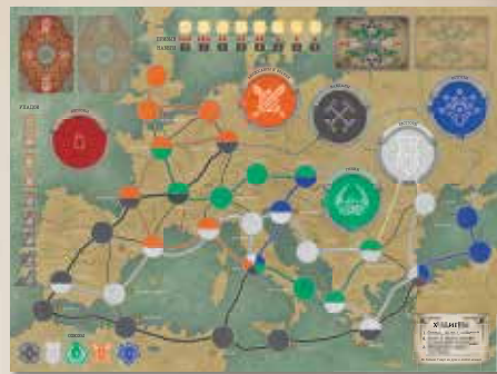
1 игровое поле