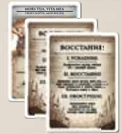
70 карт игроков (49 карт городов, 14 карт событий, 7 карт восстаний)